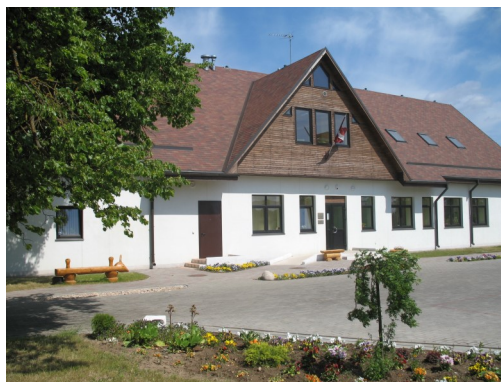
Sociālais dienests atrodas Rīgas ielā 13, Ropaži, Ropažu novads, LV-2135

Pārējās darba dienās strādājam no 8.30—13.00/ 14.00 -17.00 Piektdienās no 8.30 –14.00