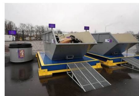
Vietalvas iela 5b, Rīga