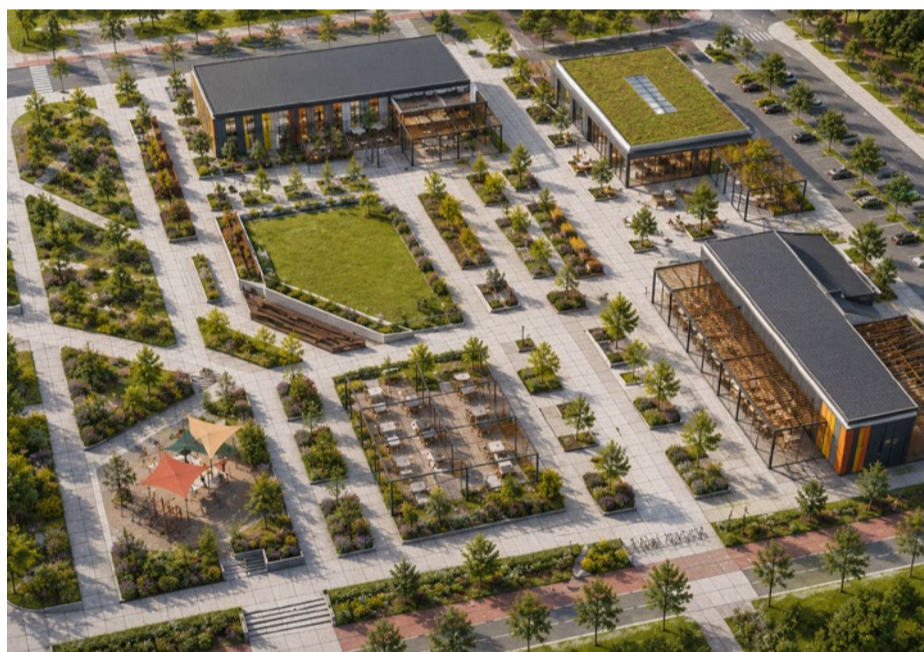
ATTĒLS VEIDOTS AR MI

Pašvaldība ir dzirdējusi iedzīvotāju pausto vēlmi tikt uzklusītiem. Tieši tāpēc tiek organizēta publiskā apspriešana – tas ir normatīvajos aktos noteiktais veids, kā oficiāli apkopot sabiedrības viedokļus un ņemt tos vērā teritorijas plānojuma pilnveidošanā. Tāpēc ir izvēlēts maksimāli garš publiskās apspriešanas termiņš, lai visas puses spētu noformulēt savu viedokli un izteikties, tieši ietekmējot