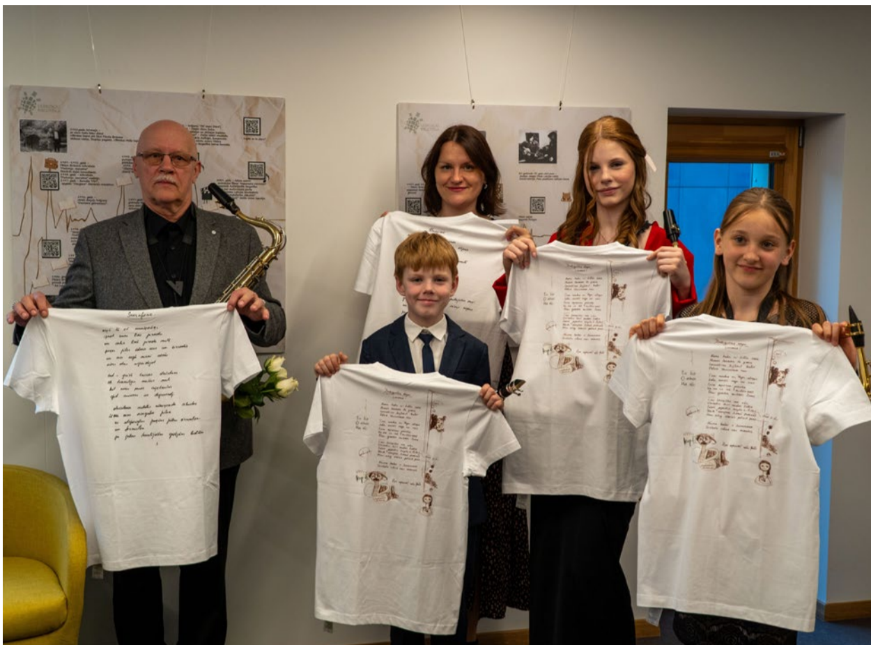
“Muzeju nakts 2026” pasākums “Priekšmeta piedzīvojums”, iedvesmojoties no Raiņa atziņas “Arī lupats reiz bij goda krekls”. Ulbrokas bibliotēka, 2026. gada 23. maijs.

Vakara spilgtākos mirkļus iemūžināja fotogrāfs Rihards Butevics, galerija apskatāma Ulbrokas bibliotēkas mājaslapā https://ulbrokasbiblioteka.lv/galerijas/ .