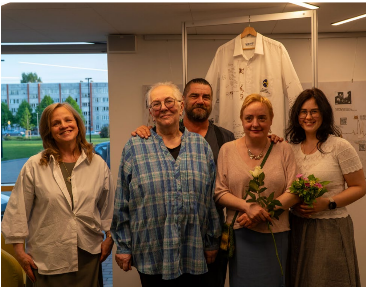
“Muzeju nakts 2026” pasākums “Priekšmeta piedzīvojums”, Ulbrokas bibliotēkas kolektīvs, 2026. gada 23. maijs.