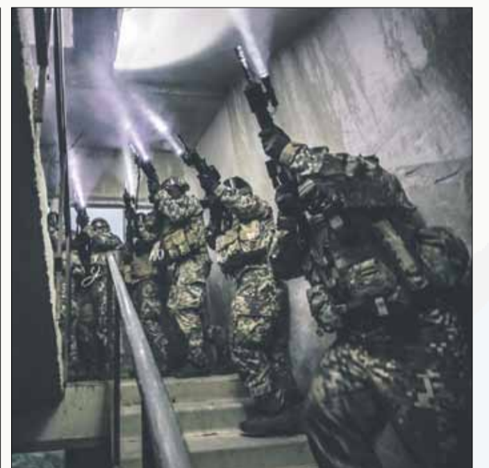
Kaujas iemaņu treniņš pilsētvidē (pretnermiernieku operācija).

Zemessardzē uzņem 18 – 55 gadus vecus Latvijas Republikas pilsoņus bez sodāmības vai apsūdzībām par nozieguma izdarīšanu. Uz kandidātiem attiecas vairāki citi ierobežojumi, ar kuriem var iepazīties Zemessardzes mājas lapā: www.zs.mil.lv Vairāk informācijas par Zemessardzes 1. Rīgas brigādi: www.zs.mil.lv > ZS vienības > Zemessardzes 1. Rīgas brigāde.