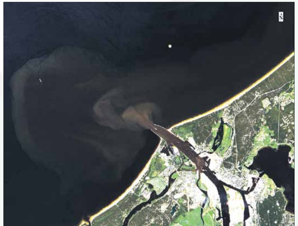
Eiropas Kosmosa aģentūras satelīta Landsat attēlā redzama Daugavas ieteka Baltijas jūrā.

Baltijas jūras piesārņojums ir aktuāla Eiropas līmeņa problēma. Lai ar to cīnītos, 2015. gada oktobrī uzsākts Somijas, Zviedrijas, Igaunijas un Latvijas pētnieku sadarbības projekts WATERCHAIN, kura mērķis ir mazināt bīstamo un barības vielu ieplūdes Baltijas jūrā.