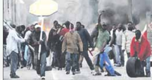
Islāmistu nemieri Itālijā

ropeiski dekadentisku dzīves stilu”, “bezgaumīgām” karikatūrām, “ar vārda brīvību pret vārda brīvību”, utt. Šī pārliecība izriet no svētajiem rakstiem korāna, ko tie liek kā neapgāžamu argumentu visām savām darbībām. Tas viss “kārtīgi radikāla” islāmista prātā ir spējīgs radīt vēmi nogalināt. Tāpat kā tas ir noticis Tunisijā, Francijā, Anglijā, ASV, Itālijā un citur Pasaulē. Tam pretī, savukārt, stājās vietējo iedzīvotāju protesti un nemieri, kas arī nav patīkami. Rodas konflikts, kur sastopas divas mentalitātes ar iesakņotām tradīcijām jau no Krusta kara laikiem un, varbūt, pat senāk. Viena pasīvi pretēja pretī otram aktīvi pretējai. Runā, ka šie bēgļi bēg no represijām un sliktas dzīves. Pēc tam, savukārt, ignorē sabiedrisko kārtību, likumus un izdemolē Itālijas Dienvidus, utt. Sprotams, ka šos cilvēkus Itālija negrib sev paturēt, bet gan “izdalīt” citām Eiropas Savienības valstīm.