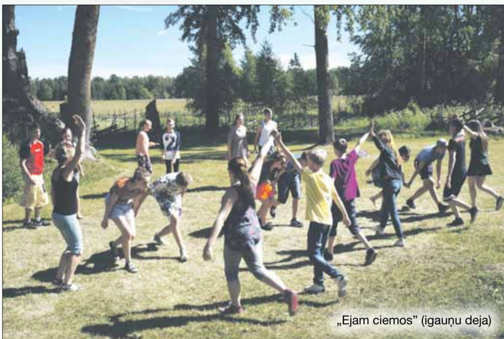
„Ejam ciemos” (igauņu deja)