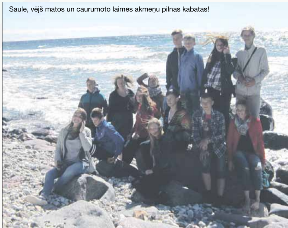
Saulē, vējš matos un caurumoto laimes akmeņu pilnas kabatas!