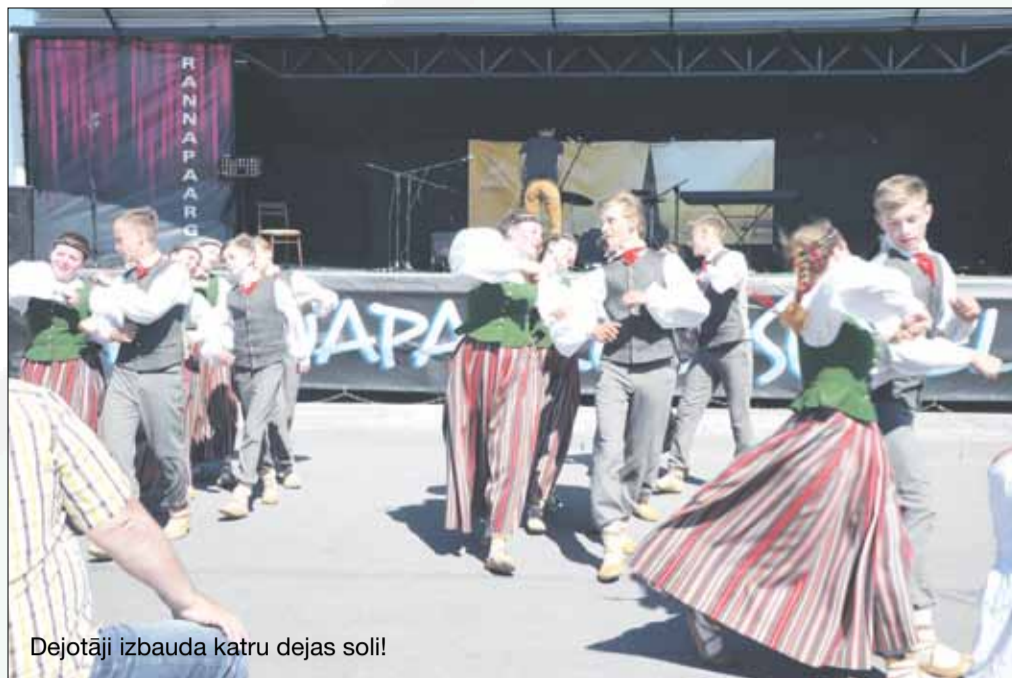
Dejotāji izbauda katru dejas soli!

Braucienam dokumentēja un aprakstīja Inga Pelcmane un Daina Grudule.