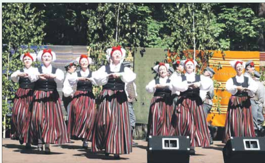
SDK "Baltābele" republikas SDK F grupā atkal augstākā kategorija un uzstāšanās Latvijas Etnogrāfiskā brīvdabas muzeja gadatirgū.