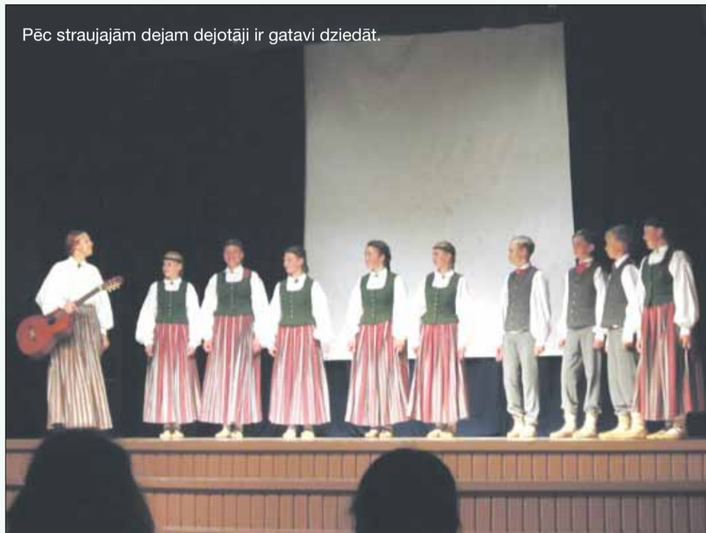
Pēc straujajām dejām dejotāji ir gatavi dziedāt.