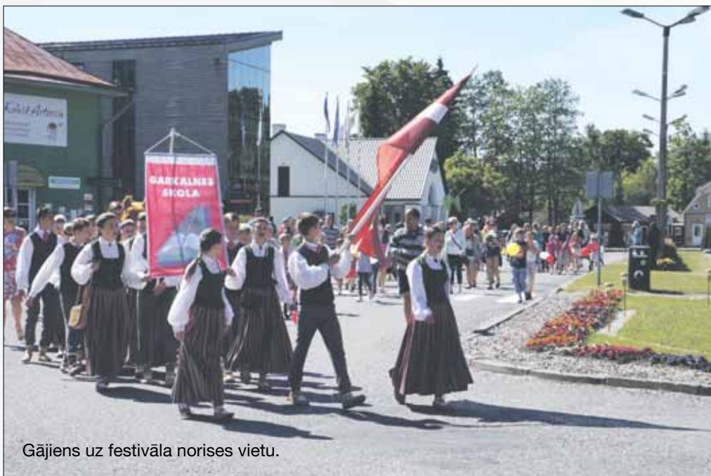
Gājiens uz festivāla norises vietu.