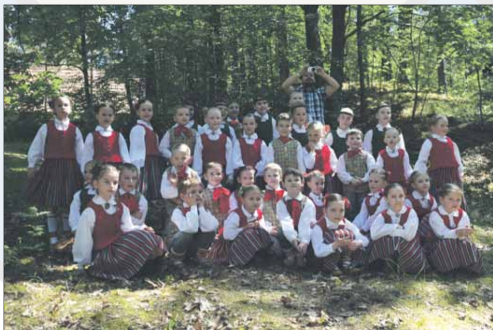
Garkalnes novada BDK "Pasaciņa" dejo Brīvdabas muzejā.