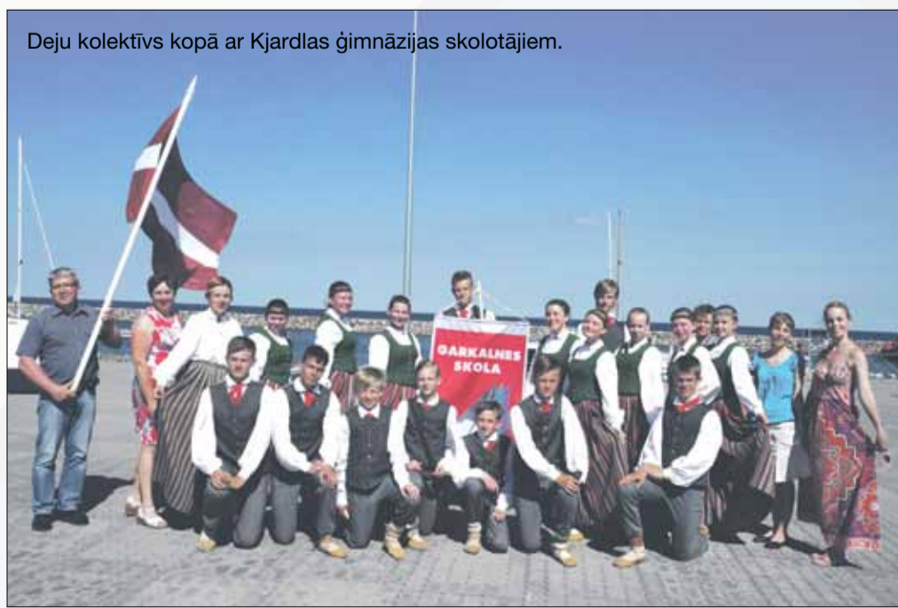
Deju kolektīvs kopā ar Kjardlas ģimnāzijas skolotājiem.