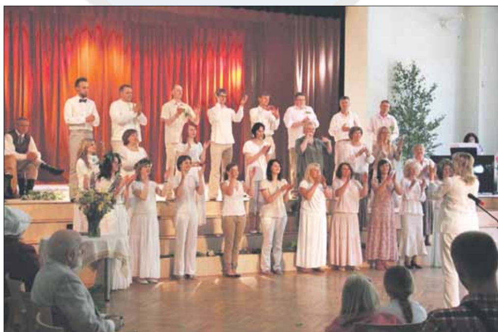
Koncerts "Nāc nākdama, Jāņu diena!" kultūras centrā "Bergī". Ierakstu skatieties Garkalnes Televīzijā.