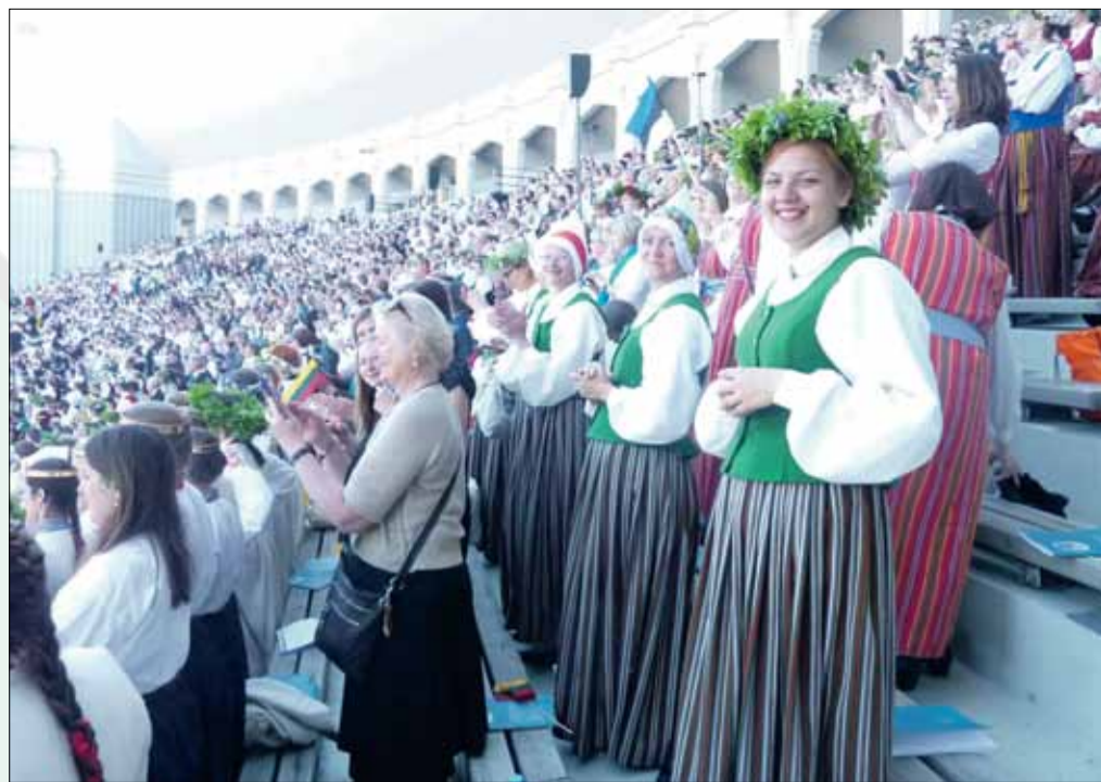
Garkalnes jauktais koris "Garkalne" Ziemeļu un Baltijas valstu dziesmu svētkos.