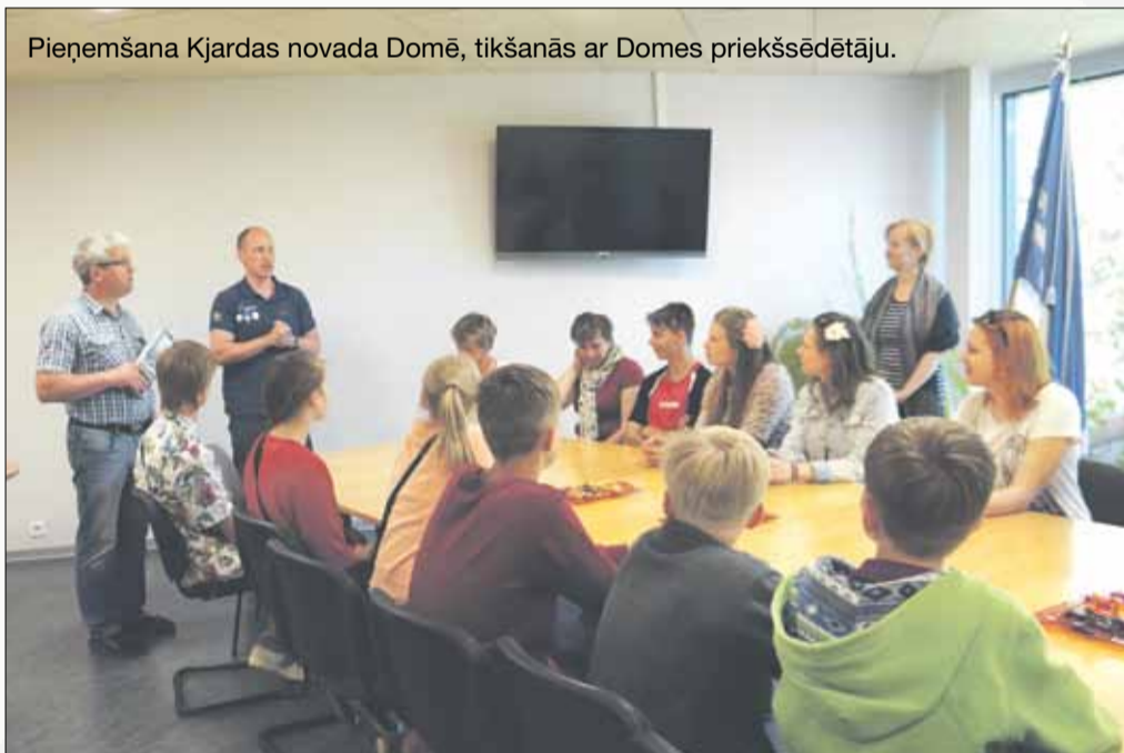
Pieņemšana Kjardlas novada Domē, tikšanās ar Domes priekšsēdētāju.