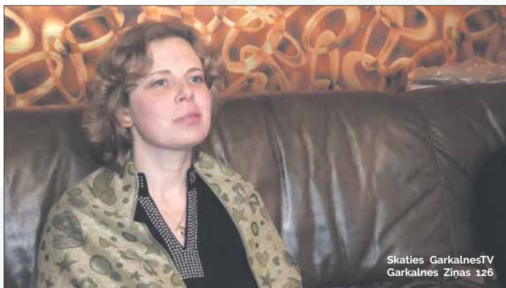
Skaties GarkalnesTV Garkalnes Ziņas 126

Vecākiem cilvēkiem būtu ieteicamas maigākas masāžas, jo daudziem varētu būt augsts asins spiediens, artrīta izraisītas sāpes. Tāpēc es ieteiktu mazliet maigāk pieiet, teiksim cilvēkiem, kas ir pēc sešdesmit gadiem. Savukārt, ar bērniem ir jārunā. Ir bērni, kuriem ne pārāk patīk masāžas, bet pārsvarā ar