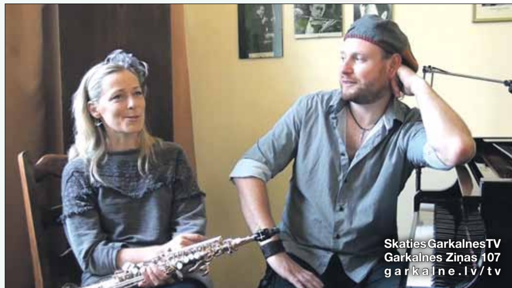
Skaties GarkalnesTV Garkalnes Ziņas 107 garkalne.lv/tv