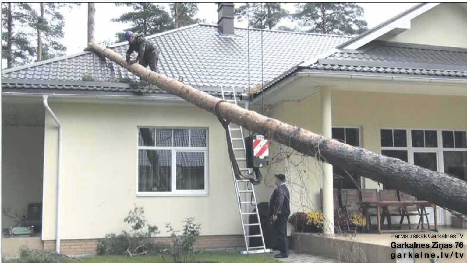
Par visu sīkāk GarkalnesTV Garkalnes Ziņas 76 garkalne.lv/tv