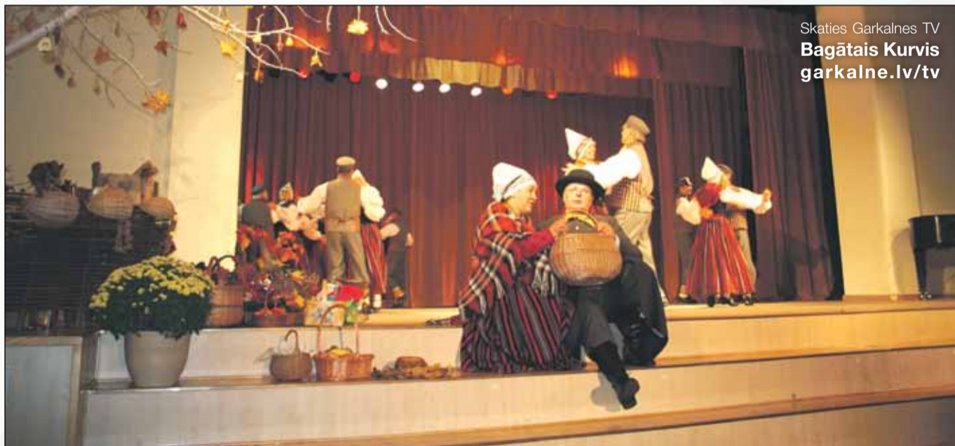
Skaties Garkalnes TV Bagātais Kurvis garkalne.lv/tv