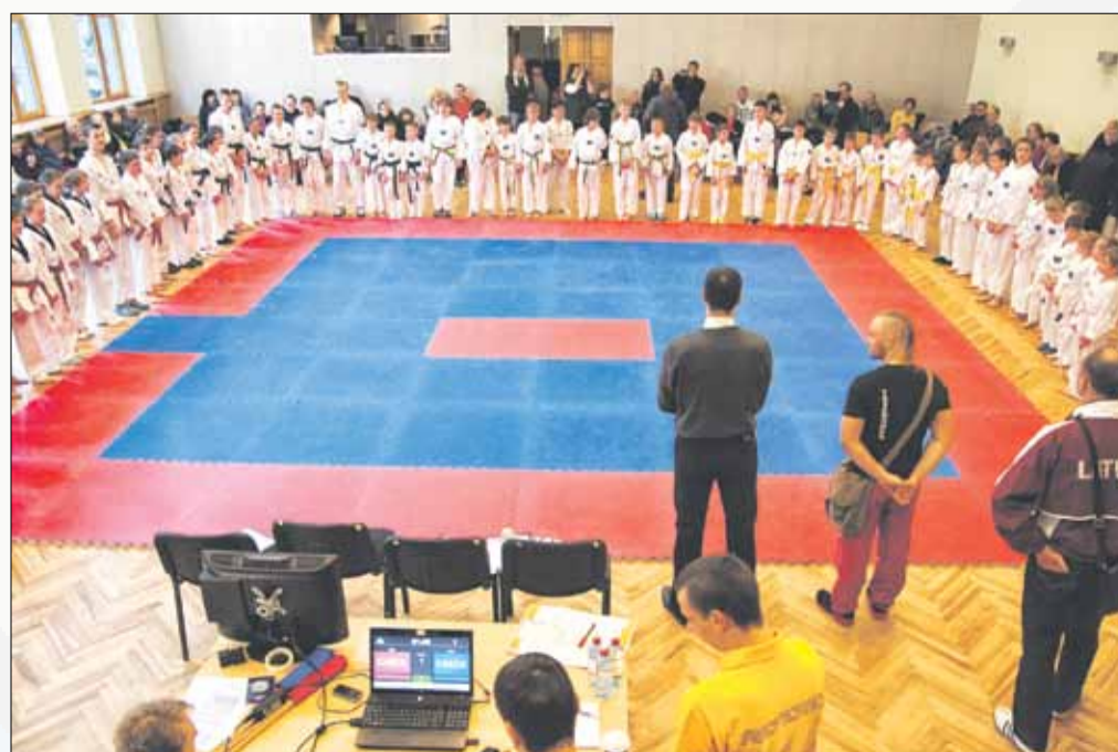
Kultūras centra “Bergī” telpās pulcējās vairāk par 70 sportistiem kas mērojās spēkiem taekvondo kirugi un pumse.