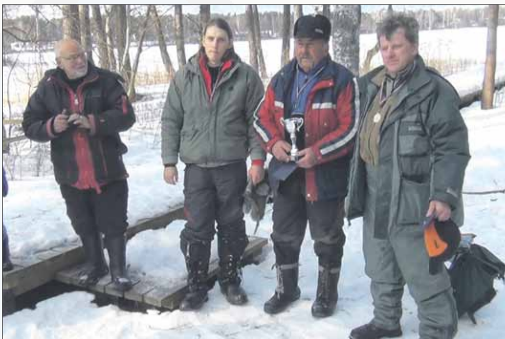
23. martā Langstiņu ezers pulcināja zemledus makšķerniekus no tuvienes un tālienes uz Langstiņu ezera kausu 2013. Sīkāk Garkalnes Ziņās 50 – garkalne.lv/tv