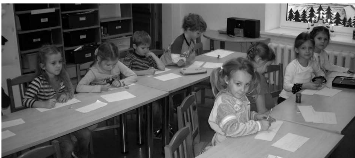
Pirmsskolas grupas piecgadīgie bērni.