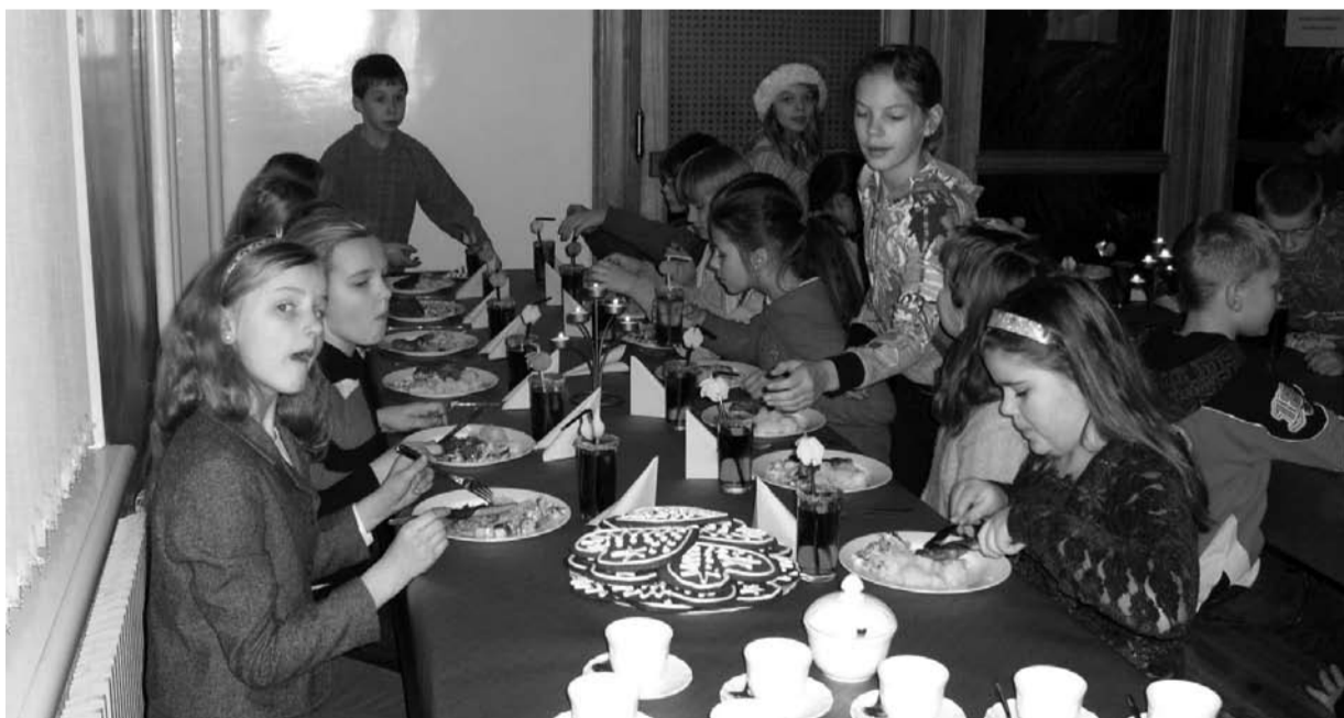
Svētku pusdienas Berģu pamatskolā.