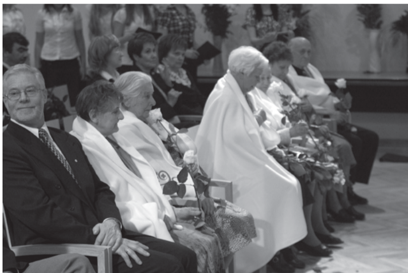
LSK 90 gadu jubilejā – prezidents Olafs Brūvers un vecbiedri