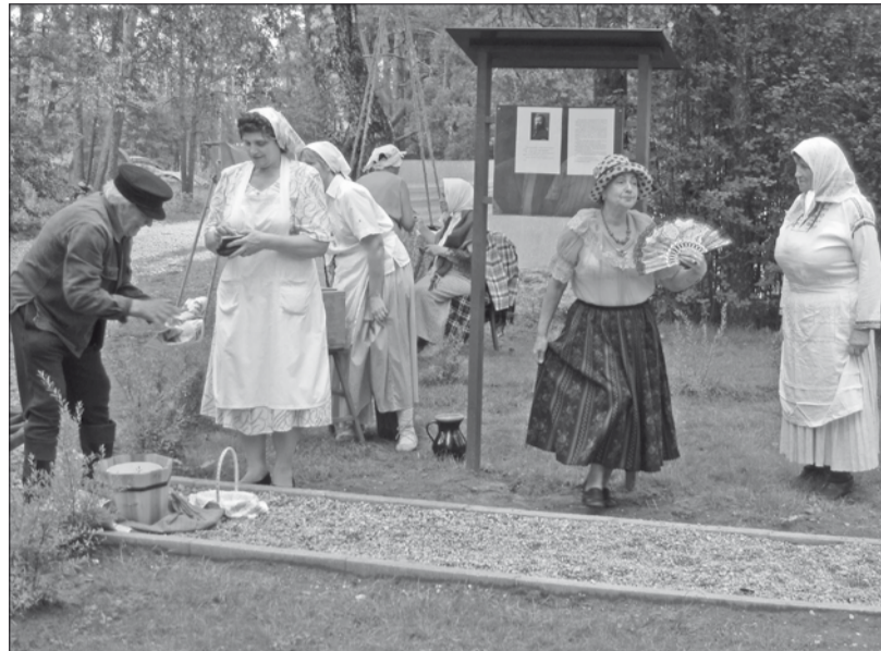
Dāmu klubiņa "Pilādzītis" izrāde "Siļķe", kas tapusi pēc Jaunsudrabiņa darba motīviem.

Šogad, Jaunsudrabiņa 130. jubilejas gadā, Garkalnes pamatskolā norisinājās vairāki rakstniekam veltīti pasākumi. Tika organizēts gan zīmējumu konkurss, gan Jaunsudrabiņa daiļradei veltīta pēcpusdienu, kurā tikāties ar Neretas pagas-