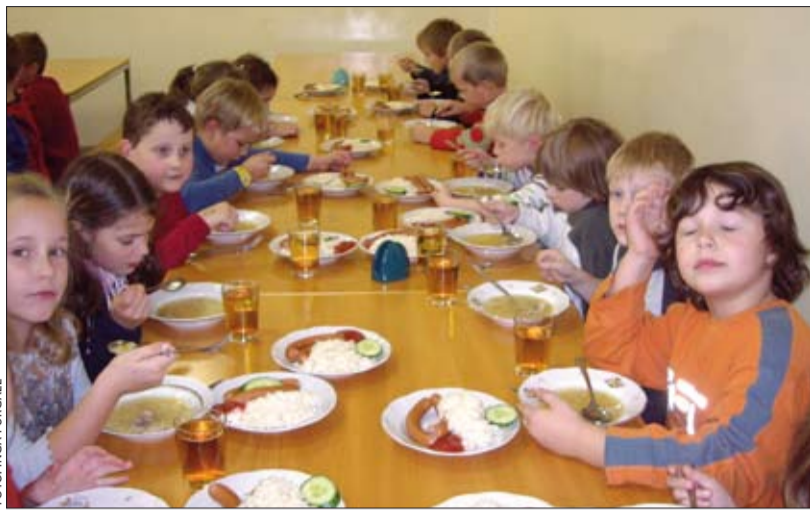
Berģu pamatskolas pirmklasnieki gardi tiesā pusdienas, kuras apmaksā Garkalnes novada dome.

Šajā mācību gadā visiem 1. – 4. klašu skolēniem, kuri deklarēti Garkalnes novadā, ir patīkams jaunums – dome nolēmusi piešķirt brīvpusdienas. “Garkalnes novada dome no šā gada budžeta brīvpusdienu finansēšanai līdz pirmā semestra beigām atvēlējusi 10 000 latu. Par šiem līdzekļiem pusdienas saņems apmēram 170 bērnu”, stāsta domes priekšsēdētājs Juris Silovs.