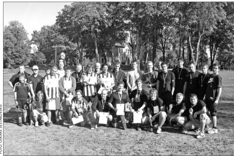
Komandas pēc mačiem.