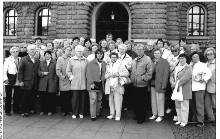
Senioru kopbilde Vācijas lielākajā pilsētā Hamburgā.

Mājās devāmies ekskursijā Garkalne–Sigulda–Līgatne–Garkalne. Ciemojamies Siguldas Saltavotā, ter-