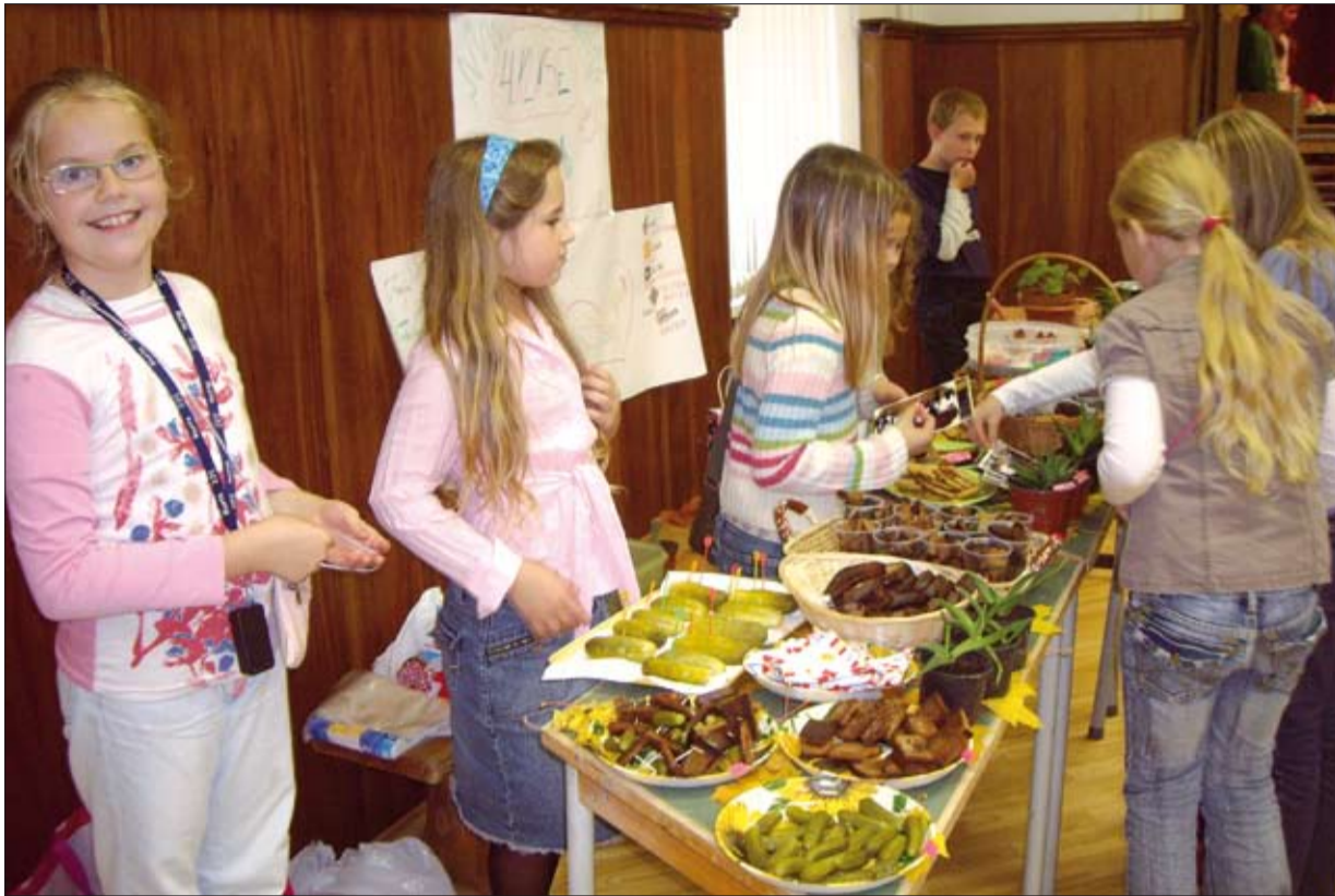
Bērni lielākoties pārdeva gardumus, kurus iespējams sagatavot mājās – marinētus gurķišus, ķiploksmaizītes, cepumus un citus gardumus.

Interesanti pavērot, cik draudzīgi un godīgi mazie pārdevēji nomaina cits citu un izpalīdz pārdojot vēl neiztirgotu preci. Un, ja nu nepavisam nepērk, var jau arī nolaist cenu vai vienkārši padalīties ar draugiem. Tas labi parā-