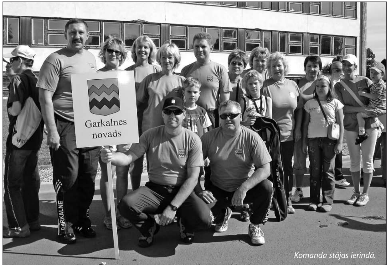
Komanda stājas ierindā.

Pēdējos gados Garkalnes novada darbinieki spītīgi mēģina pierādīt savu fizisko varēšanu Rīgas rajona pašvaldību darbinieku sporta spēlēs. Šogad augustā 11. vasaras spēles notika tepat kaimiņos – Ādažu novadā. Kopvērtējumā – 11. vieta, tieši pa vidu!