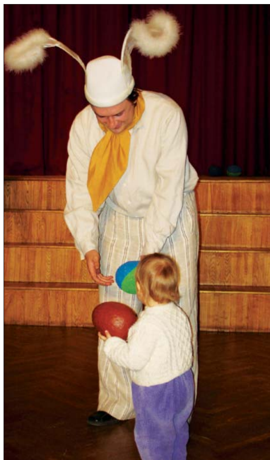
Mazie bērni bija pārsteigti par Lieldienu zaķa atnestajām olām, kuras bija nokrāsotas zilas un zaļas.

Otrajās Lieldienās kultūras namā "Berģi" bērni kopā ar Valmieras teātra aktieriem mēģināja noskaidrot, kurš Lieldienu ritā nes olas – zaķis vai pastnieks.