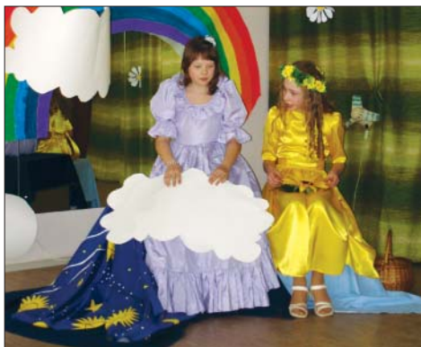
Fragments no izrādes "Rasa – debesu princese".

Tālāk sekoja jautras izdarības ar olām, kuras katrs bija paņēmis līdzi. Krāsainās oliņas varēja sist, šūpot, ripināt pa reni un pēc tam, protams, apēst. Bērni ieskandināja Lieldienas ar dziesmām, spēlēm un šūpošanas, jo visi zināja, ka tikai tā var izpildīt Lieldienu ticējumus un līdz nākamajiem svētkiem dzīvot priekā un laimē.