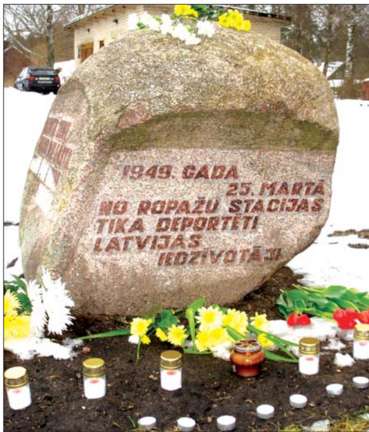
Piemiņas akmens uzstādīts pie Garkalnes vilciena stacijas "Ropaži".