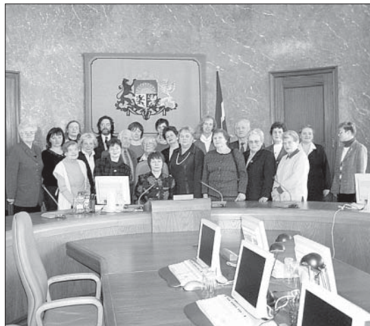
Aktīvākie pensionāri pozē objektīvam pie premjera Aigara Kalviša darbgalda Ministru kabinetā.

"Sabiedrības līdzdalības iespējas politikas veidošanas procesā Latvijā un Eiropā".