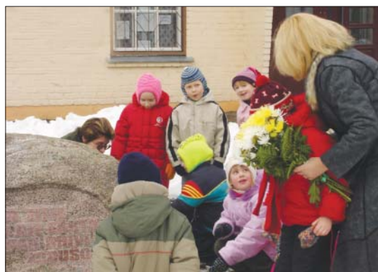
Bērni kopā ar amatpersonām noliek ziedus pie piemiņas akmens, uz kuru rakstīti vārdi: "Dzimtā zeme raud aiz lāsta, raud par brīvi zudušo..."

skaidroja, ka toreiz neviens nezina, kurp dosies un vai tiks atpakaļ. Cilvēkus nebrīdināja, un neviens nepaskaidroja, kāpēc jābrauc, vien paziņoja, ka būs izvešana. "Viņus aizveda pie brūnajiem lāčiem, cilvēkus ievietoja lielajos vilcienu vagonos un veda tālu prom, daudzi nemaz neatgriezās," bērniem stāstīja priekšsēdētāja.