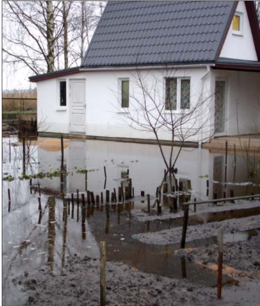
Bukultos plūdu laikā iedzīvotāju mazdārziņus klāja vairāku centimetru bieža ūdens sega.

Droši vien ikkatram atmiņā palikuši janvāra negaidītie dabas untumi, kad vieglāk bija pārvietoties ar laivām un gumijas zābakiem nekā automašīnām un citiem transporta līdzekļiem.