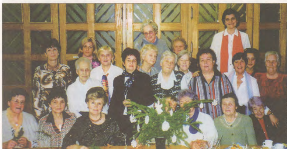
Interesu kluba "Strauts" aktivistu kopa aug arvien straujāk.