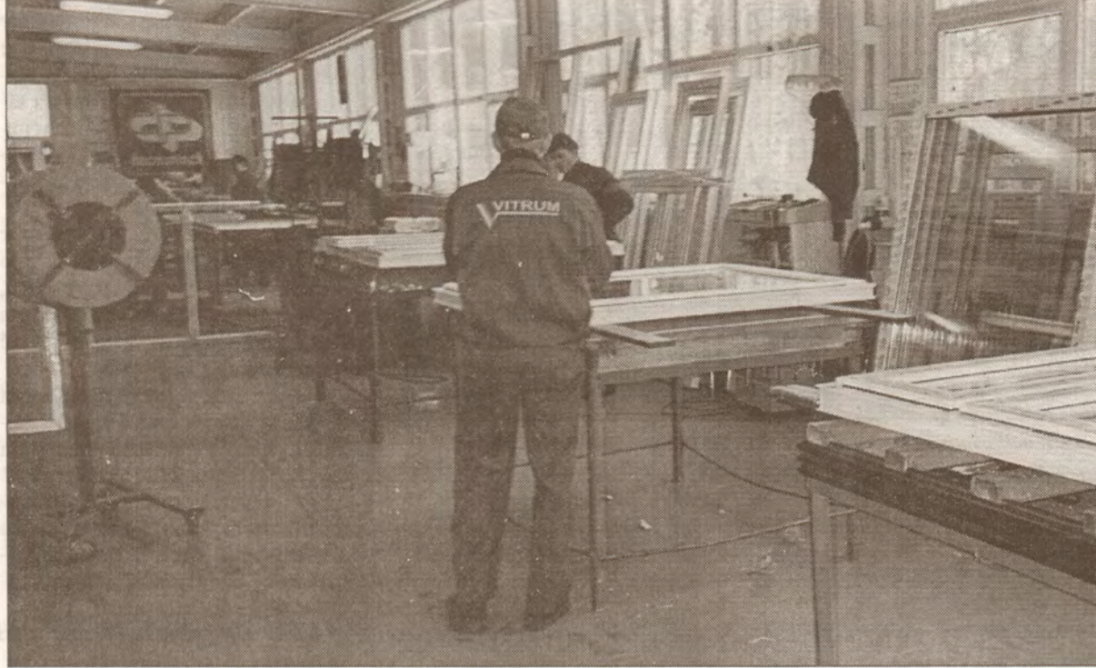
Logu salikšana notiek ļoti rūpīgi.

Fonds «Saules smaids» un «Neatkarīgā Rīta Avīze» rīko labdarības akciju "Dāvināsim bērniem " veselību» zvanot pa tālr. 9006288Jūs ziedojat 1latu Bērnu Klīniskās slimnīcas Reaminācijas nodaļai.