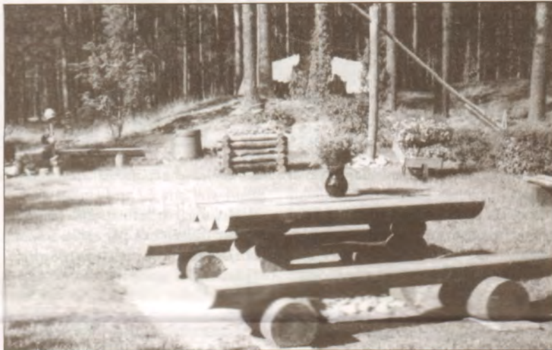
Daudzdzīvokļu māju grupā godalgoti "Remberģi - 1" ar glīto mājas apkārtni, ko rotā aka.

Baltezers - Kāpa Mirdza - Senču prosp. 33a (ar minimāliem līdzekļiem - puķupodiem ir sasniegts maksimāls efekts)