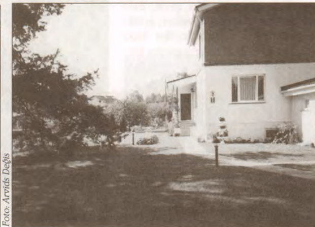
Mulareka Ināra - Mālpils šoseja 2, Garkalnē.