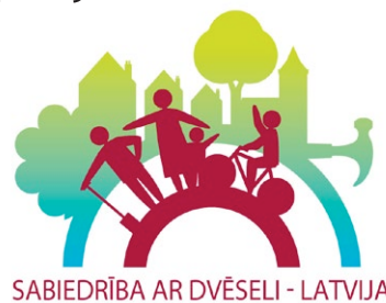
SABIEDRĪBA AR DVĒSELI - LATVIJA

Ropažu novada pašvaldība organizē Atbalsta konkursu iedzīvotāju iniciatīvām “Sabiedrība ar dvēseli 2022”. Konkursa mērķis – uzlabot dzīves kvalitāti fiziskajā un sociālajā jomā Ropažu novadā, veicināt novada iedzīvotāju iniciatīvu un atbildību par savu dzīves vidi. “Sabiedrība ar dvēseli 2022” notiek projektu konkursa veidā.