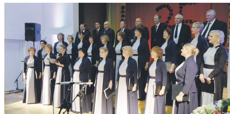
Jubilejas koncertā koris uzstājās pavisam jaunos tērpos, kas izpildījuma skaisto skanējumu papildināja ar īpašu noskaņu.