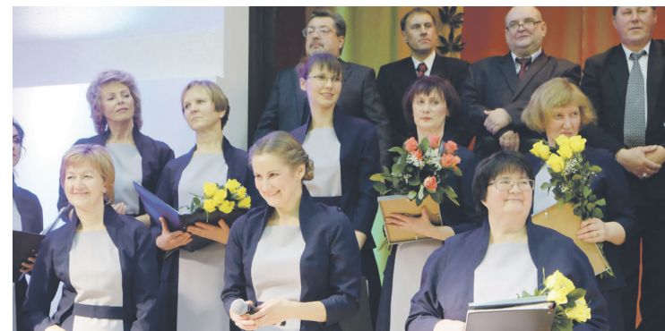
Skaists koncerts, smaidīgi un apmierināti kora dalībnieki.