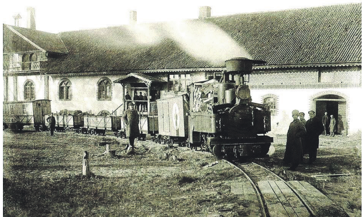
„Dzelzceļi Latvijā”, va/s „Latvijas dzelzceļš”, apgāds „Jumava”, 2009. g.

Otra līnija ar sliežu platumu 600 mm sākusies no Ikšķīles stacijas ar pieturas punktiem Kaparāmurs–Tinuži, kur dzelzceļš sadalījās divos atzaros: uz A pusi novirzījās uz Kranciemu,