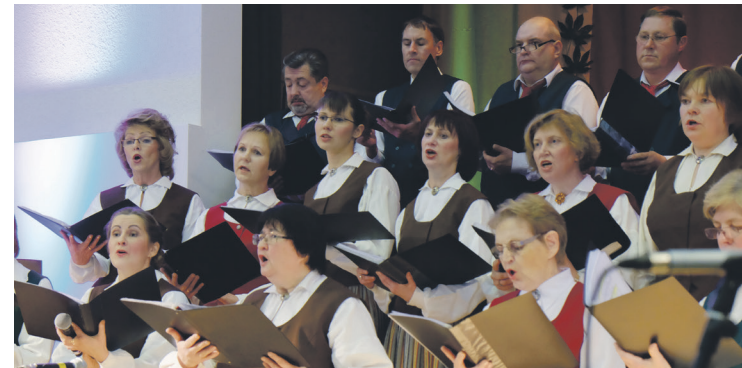
„Ja tā, kā ap dziesmu stāvam, Mēs stāvētu ap savu garu – Plecs pie pleca, uguns pa vidu... Plecs pie pleca – par katru staru.”