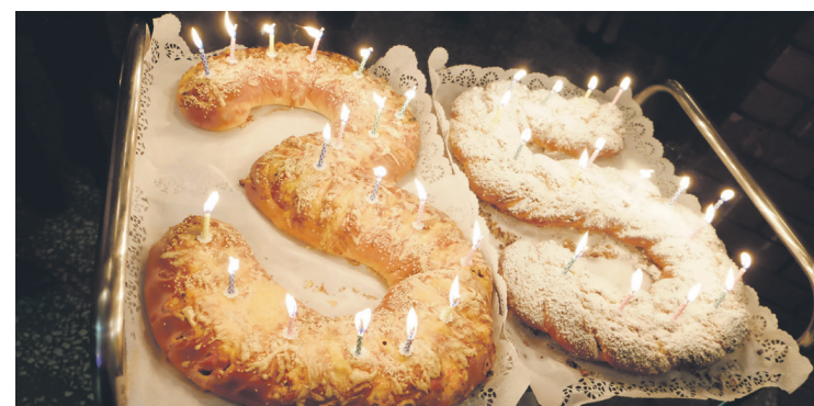
Ropažu novada pašvaldības sveiciens korim „Ozolzīle” 35 gadu jubilejā.