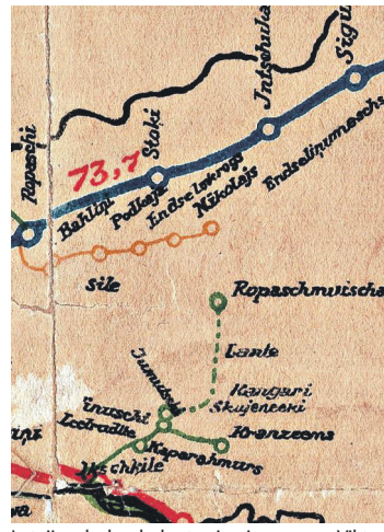
Latvijas dzelzceļu kartes izgriezums no Viktora Baumaņa privātkolekcijas, izdota 1925. g.

no Ikšķīles stacijas uz Ropažu muižu aktīvi izmantota arī Latvijas brīvības cīņās 1919. gadā. Abu šaursliežu dzelzceļu uz-