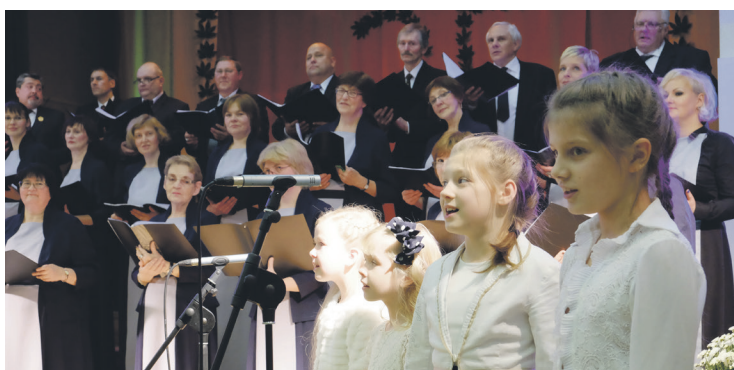
Kopā ar mazajiem dziedātājiem un koncerta klausītājiem tika izdziedāta arī skaistā Renāra Kaupera „Mana dziesma”.