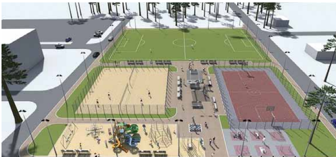
Būvniecības iecere Sporta laukumiem Silakrogā.

Sporta laukumu atrašanās plānota uz pašvaldības zemes. Sporta laukumiem nepieciešamo teritoriju paredzēts palielināt un atbrīvot no saaugušajiem krūmiem, maziem un lielajiem kokiem. Kopējā teritorija – 7000 m 2 . Bērnu rotaļu laukumi plānoti tuvāk daudzdzīvokļu mājām. Volejbola un basketbola laukumus paredzēts apjot ar sētu, savukārt futbola laukumam paredzētas sētas jeb sieti laukuma galos.