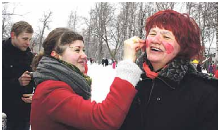
Svētku dalībnieki, izpildot Lieldienu rituālus, ēda dzērvenes spēkam un mazgāja mutes, šogad gan – nevis upes ūdenī, bet sniegā...