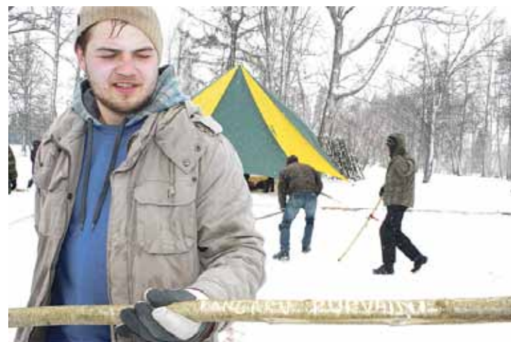
Mājnieki "Kangaru purvaini" Liieldienu svinēšanas laikā Ropažos ieguva 1. vietu Latvijas čempionātā Ripas spēlē.