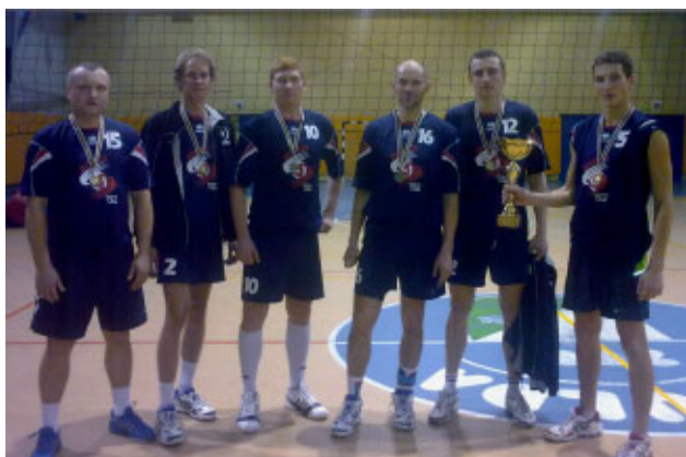
VK „ROPAŽI” ar izcīnīto 1.vietas kausu Pierīgas novadu sporta spēlēs

Jau 2.gadu Ropažu novada volejbola vīriešu un sieviešu - abas komandas ir absolūtie čempioni Pierīgas novadu konkurencē. Apsveicam abas mūsu komandas ar noturētu 1.vietu!