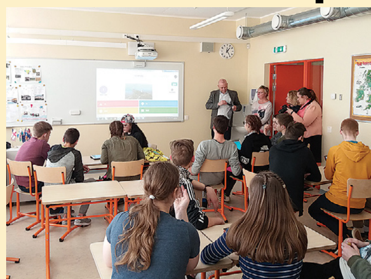
Inčukalna pamatskolas audzēkņi piedalījās draudzības viktorīnā „Latvijai, Igaunijai – 100”.