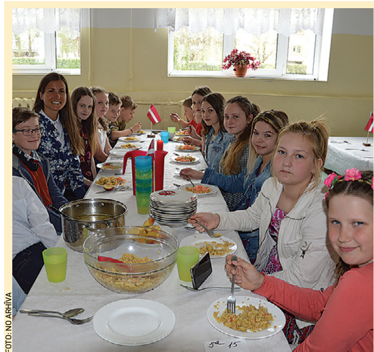
Vangažu vidusskolas 5.a klase pie baltā galdauta galda 4. maijā.