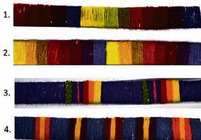
Piedāvātie brunču auduma krāsu salikumi, no kuriem bija jāveic izvēle