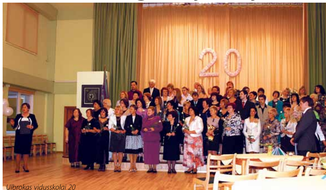
Ulbrokas vidusskolai 20