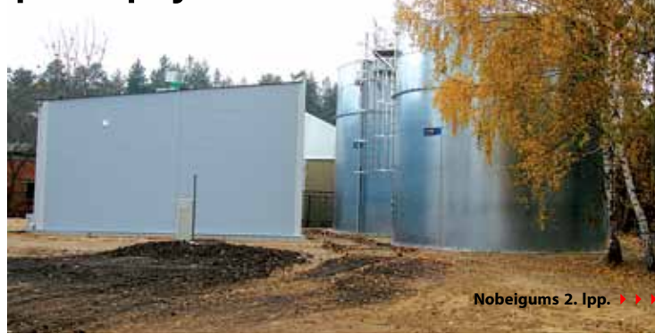
Nobeigums 2. lpp. ▶▶▶