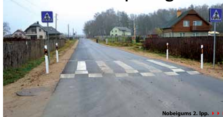
Nobeigums 2. lpp. ▶▶▶