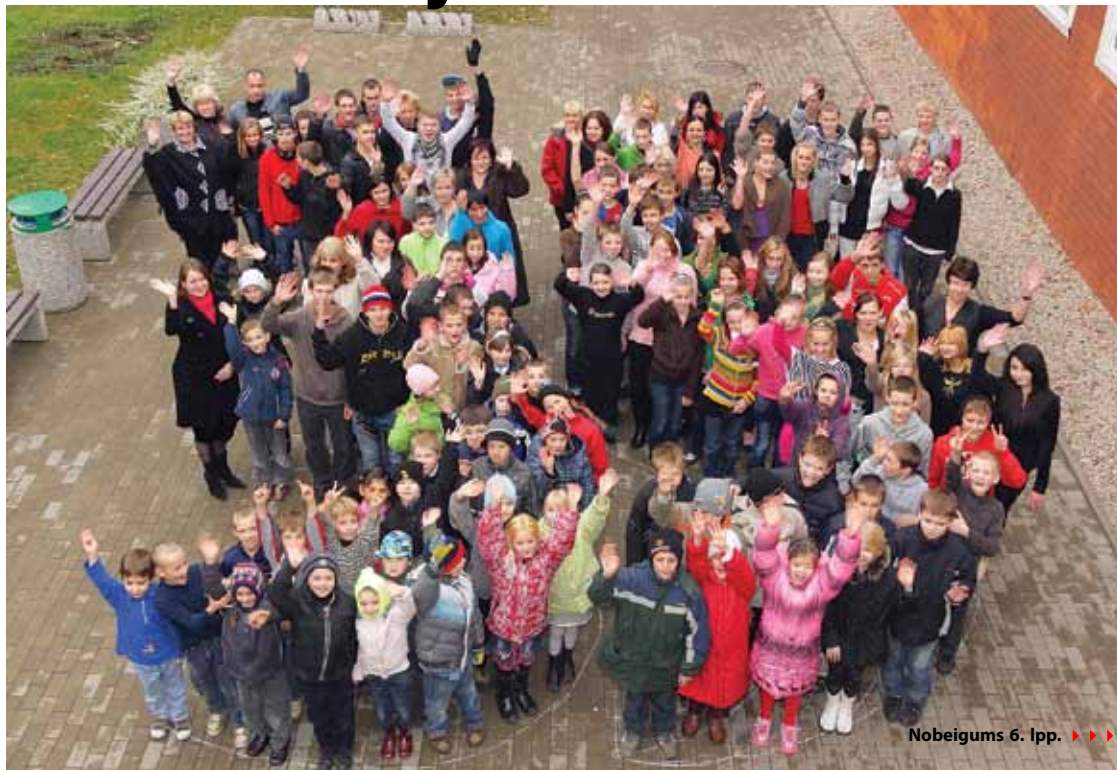
Nobeigums 6. lpp. ▶▶▶