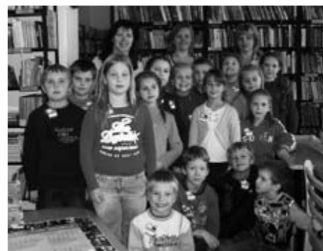
MĒS – 2.A KLAŠE GRĀMATU PASAULĒ...

Visu iepriekš pieminēto, bērni varēja izbaudīt arī skaistumkopšanas salonā. Meitenes jutās kā princeses, jo viņu slēptākās vēlēšanās tika izpildītas kā uz burvju mājienu. Tapa skaistas frizūras, tika sakopti un nolakoti naziņi un kur nu vēl meikaps... Zēni bija sajūsmā par savu meiteņu pārvērtībām un