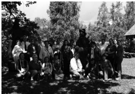
STOPIŅU NOVADA LĪGOTĀJI «KALNA KAIBĒNOS»

Jāņu nakts tuvošanās un dabas ziedošā, spēcinošā burvība Stopiņu novada bibliotēkas ļaudis mudina doties Vidzemes Centrālās augstienes virzienā. Ceļš, kas, mūs pavada, paver nebijušus skatus, kur daba kā bez prāta un sirds kā ziedu pļava, plūcot jāņuzāles un pinot vainagus, ļauj skatīt ko ļoti sirsnīgu un nozīmīgu literāri kultūrvēsturisko vērtību un latvisko tradīciju ziņā.