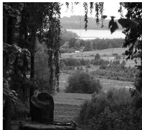
VIDZEMES SKAISTIE SKATI