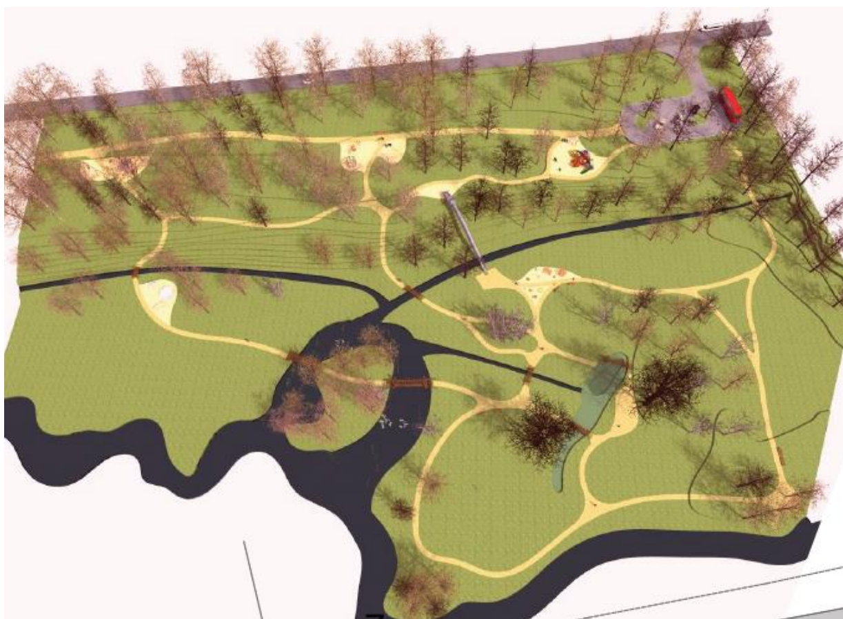
1.attēls. „Ozolu spēka avots” attīstības ieceres materiāls.

Zemes vienības „Liepaines” ar kopējo platību 2,67 ha un „Kurmīši” ar kopējo platību 1,01 ha ir pašvaldības īpašums. Detālplānojuma teritorija, kas ietver minēto īpašumu daļas, pašreiz ir neapbūvēta, ar reljefa kritumu Tumšupes virzienā. Teritoriju veido koku un krūmāju blīvs apaugums, kur lielākā vērtība ir ozoli un kurā plānota attīstības iecere „Ozolu spēka avots”. Minētā iecere paredz vienotu attīstības koncepciju iedzīvotāju atpūtas vietas radīšanai, kur plānotas dabas izziņas takas ar dažādiem pastaigu maršrutiem un teritorijas labiekārtojumu – soliemi, bērnu rotaļu vietām u.c. Piekļuve atpūtas vietai paredzēta no autoceļa P3, veidojot autonovietni apmeklētājiem zemesgabalā „Kurmīši”. (sk. 1.attēlu).