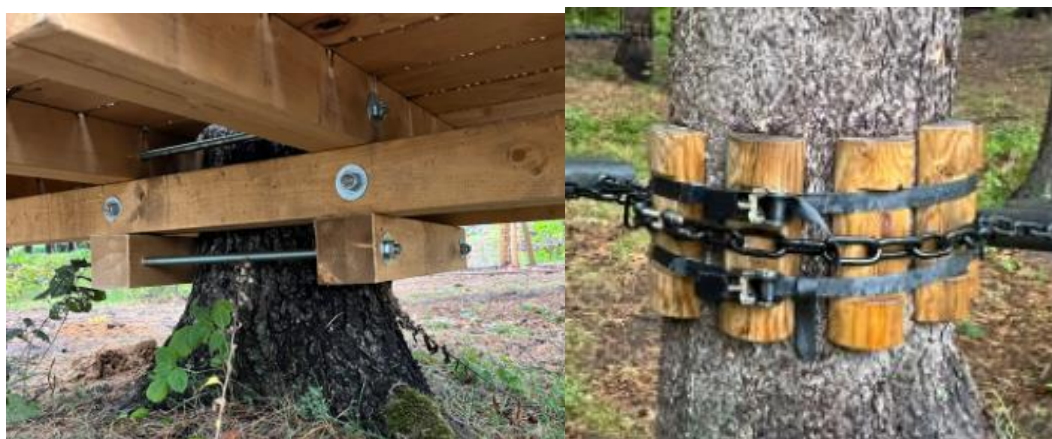
3. attēls. Trases stiprinājumu veidi, kas nebojā kokus.

Trasi plānots izvietot un stiprināt starp parka priedēm, tā, lai priedes netiktu bojātas veicot urbumus stumbros (3. attēls).