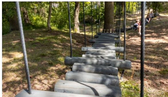
5. attēls. Virvju trase Vangažos

https://www.ropazi.lv/lv/jaunums/vangazu-pilseta-atklata-virvju-skerslu-trase