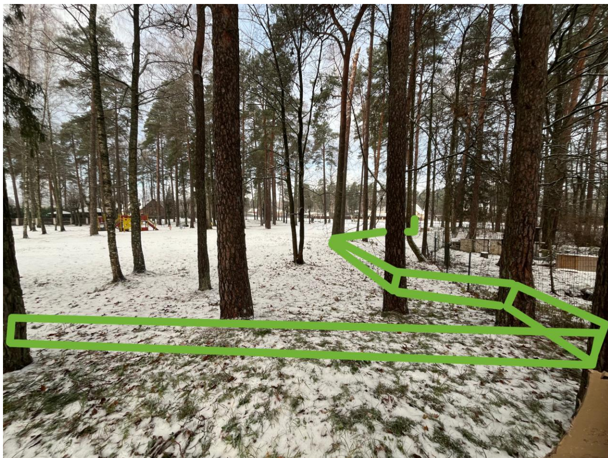
2. attēls. Trases iespējamā izvietojuma ilustrācija.

Trasi plānots izvietot un stiprināt starp parka priedēm, tā, lai priedes netiktu bojātas veicot urbumus stumbros (3. attēls).