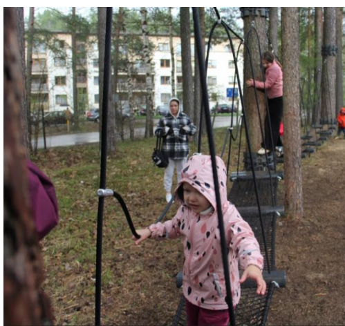
6. attēls. Tīklu trase Upeslejās.

https://www.ropazi.lv/lv/jaunums/vangazu-pilseta-atklata-virvju-skerslu-trase