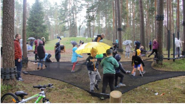
8. attēls. Tīklu batuts Upeslejās.

https://www.ropazi.lv/lv/jaunums/upeslejas-pie-bernu-laukuma-atklata-tiklu-trase