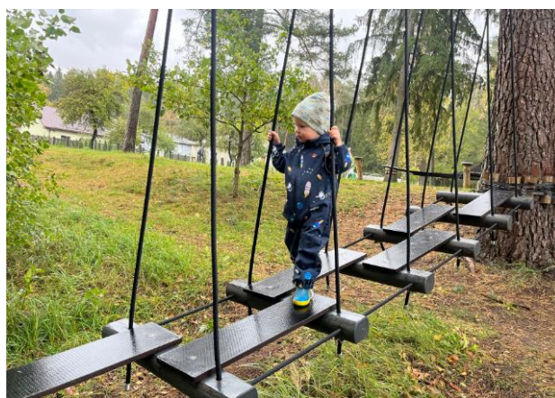
7. attēls. Virvju trase Vangažos.