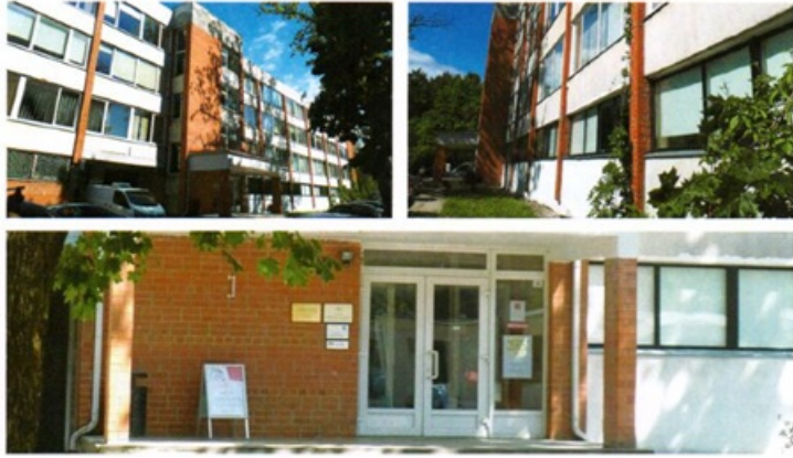
Stopiņu novada Ulbrokas bibliotēka

Vairāku projektu ietvaros tiek apzināts kultūras kanons un kultūras mantojuma kopums, kas atspoguļo uzkrātās un no jauna radītās nacionālās identitātes un kultūras vērtības seno māju un citu rakstu kontekstā. Stopiņu novada kultūras kanons rakstu zīmēs top kā kartīšu komplekts, t.sk., ceļojošās izstādes materiāla kopa, kas atspoguļo (ne)materiālā kultūrvēsturiskā mantojuma apzinātos faktus un veic to popularizēšanu.